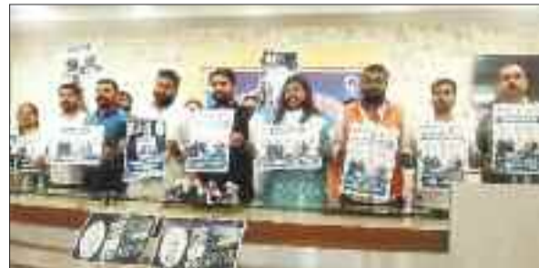
पत्रकारवार्ता में उपस्थित युवा कांग्रेस के पदाधिकारी।

केंद्र सरकार द्वारा रोजगार के नाम पर बेरोजगारों के साथ छल करने के कारण प्रदेश में पिछले 10 साल के दौरान बेरोजगारी बढ़ी है। किसी भी सरकारी विभाग में भर्ती नहीं निकली है इसलिए बेरोजगारी के साथ ही महंगाई बढ़ी है। इसलिए युवा कांग्रेस द्वारा भारत जोड़ो न्याय यात्रा के साथ रोजगार दो, न्याय दो अभियान शुरू किया गया है।