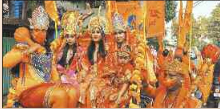
साडा कालोनी शिव मंदिर से निकली शोभायात्रा में आकर्षक झांकी।

तैयार हो गई है। आम नगरवासियों के साथ साथ जिला प्रशासन भी इस अभूतपूर्व अवसर को यादगार बनाने के लिए जिला स्तर पर कार्यक्रम आयोजित कर रहा है। शहर से लेकर उपनगरीय क्षेत्र एवं ग्रामीण अंचल भक्ति के सराबोर में