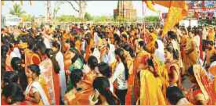
पाली शिव मंदिर से निकली शोभायात्रा।

अयोध्या में आज होने वाली रामलला की प्राण प्रतिष्ठा के दिन जिस तरह से राम की नगरी भक्तिमय हुई है उसी तरह ऊर्जा नगरी भी राम की भक्ति में डूब चुकी है। अंचल का हर हिस्सा सराबोर है। धार्मिक स्थल से लेकर सार्वजनिक स्थल एवं नदियों के घाटों से लेकर चौक-चौराहों तक सजावटों से जगमगा रहे हैं। रामलाल की अशुवानी में अंचल तैयार खड़ा है। भगवान राम की प्राण प्रतिष्ठा आज सोमवार को सरयू नदी के किनारे अयोध्या में विधि विधान के साथ इस अवसर पर देश जहां राममय हो गया है, वहीं इससे ऊर्जा नगरी भी अखूती नहीं है। राम की नगरी की भाँति ऊर्जा नगरी भी अपने रघुराई के लिए सजधजकर